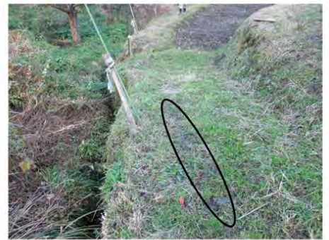
農道(幅はおよそ1.4m)を上から見たところ(楕円のところに木板を敷いていた)

道はもともと狭く(およそ1.4m)、小川側の縁は軟らかくて、車輪が食い込んだり、滑るため、それを防ぐために木の板(長さ3m、幅50cm、厚み7cmほど)を敷いていた。当日は降雨で板が濡れており、濡れた板の表面で前輪が川の方に横すべりして脱輪。