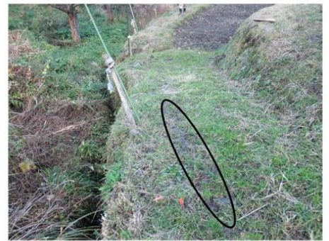
農道(幅はおよそ1.4m)を上から見たところ(楕円のところに木板を敷いていた)

道はもともと狭く(およそ1.4m)、小川側の縁は軟らかくて、車輪が食い込んだり、滑るため、それを防ぐために木の板(長さ3m、幅50cm、厚み7cmほど)を敷いていた。当日は降雨で板が濡れており、濡れた板の表面で前輪が川の方に横すべりして脱輪。