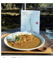
虎の尾グリーンカレー