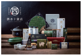
四日市市地域ブランド「酒水十貨店」